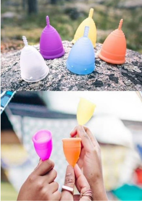
Şekil 1. Menstrüel kap

Hemşireler, kadın sağlığını etkileyen menstrüel hijyen yönetiminde önemli rollere sahiptir. Hemşirelerin bu konudaki yenilikleri takip etmeleri, yeniliklerin kadın sağlığına etkilerini ortaya koyan araştırmalar yapmaları ve elde edilen sonuçlarla bu yenilikleri hizmetlerine eklemeleri oldukça önemlidir. Bu doğrultuda derlemede; bir yenilik olarak düşünülen ve Türkiye’de oldukça az bilinen ve uygulanan bir ürün olan menstrüel kabın yapısı, nasıl kullanıldığı, dünden bugüne kullanım durumu ve bu konuyla ilgili yapılan çalışmalar, menstrüel kabın avantaj ve dezavantajları ile bu konuda hemşirenin rolleri ele alınmıştır.