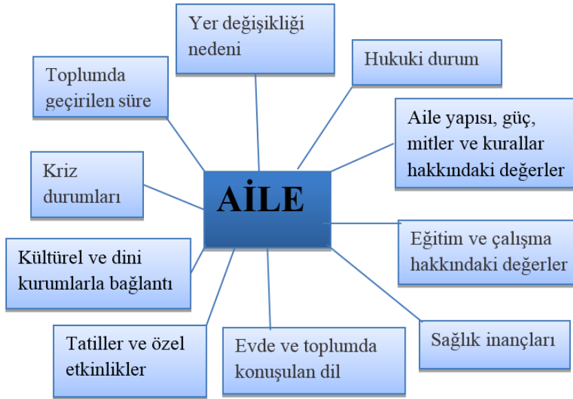
Şekil 1. Kültürogram 14,18-21

Yer değişikliği nedeni: Ailelerin yer değişikliği nedenleri çok farklı olabilir, bazıları tekrar evlerine dönebilir, bazıları dönmezler. Göçmenler memleketlerinde yetersiz sağlık hizmeti almalarına bağlı olarak sağlık problemlerine sahip olabilirler 14,18-21 ya da göç ettikleri ülkelerde uygun olmayan barınma ve beslenme koşulları, temel yaşam gereksinimlerinin karşılanamaması ve sağlık hizmetlerine erişimlerinin yeterli olmaması gibi nedenlerle bulaşıcı hastalıklar, kronik hastalıklar veya çeşitli ruhsal sorunlarla karşı karşıya kalabilirler 22 . Göçmen aileler yer değişikliğinden sonra, belirgin düzeyde anksiyete ve depresyon semptomları gösterebilir ve eğer geri dönmeyecekleri bir yerden ayrılmışlarsa derin kayıp duyguları yaşayabilirler. Bu nedenlerle, sağlık çalışanları yer değişikliğinin nedenlerini araştırmaları, hastanın ve ailesinin fiziksel ve psikolojik semptomlarını anlamada onlara yardımcı olacaktır 14,18-21 .